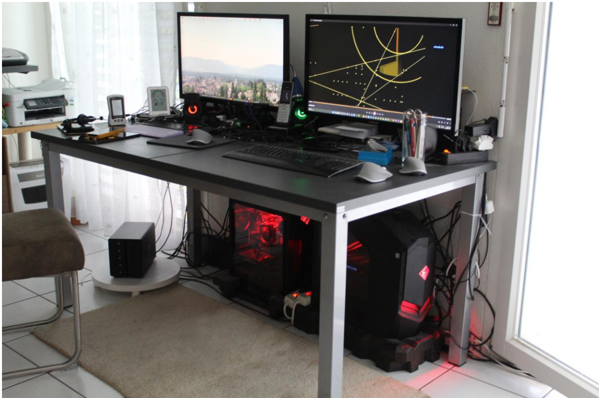
Computeranlagen zu Hause an der Oberhardstrasse 20a im Jahr 2024/25